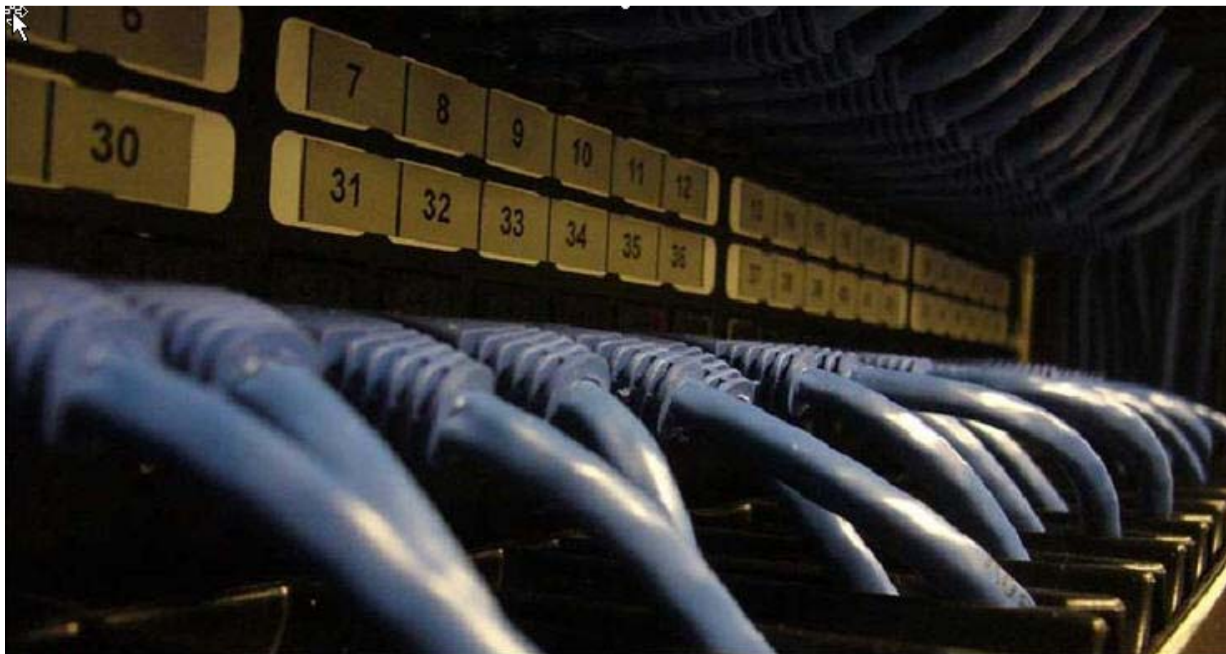
OVERVÅKER ALLE: Et nytt EU-direktiv pålegger norsk tele- og nettleverandører å lagre informasjon om alle nordmenns nett- og telefonbruk.